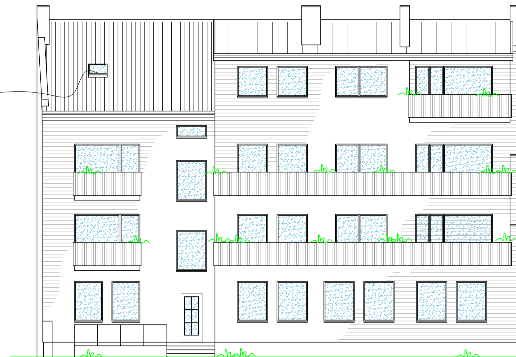
FASAD MOT SÖDER. SK. 1:100