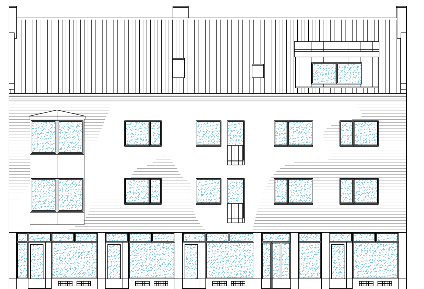
FASAD MOT ALGATAN (NORR). SK. 1:100.